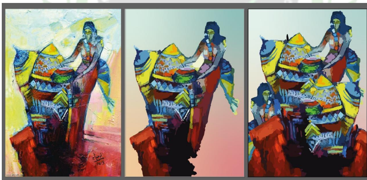
(شكل ٧) بدون عنوان عمل يعبر عن الفتاة الحجازية ٢٠١٣