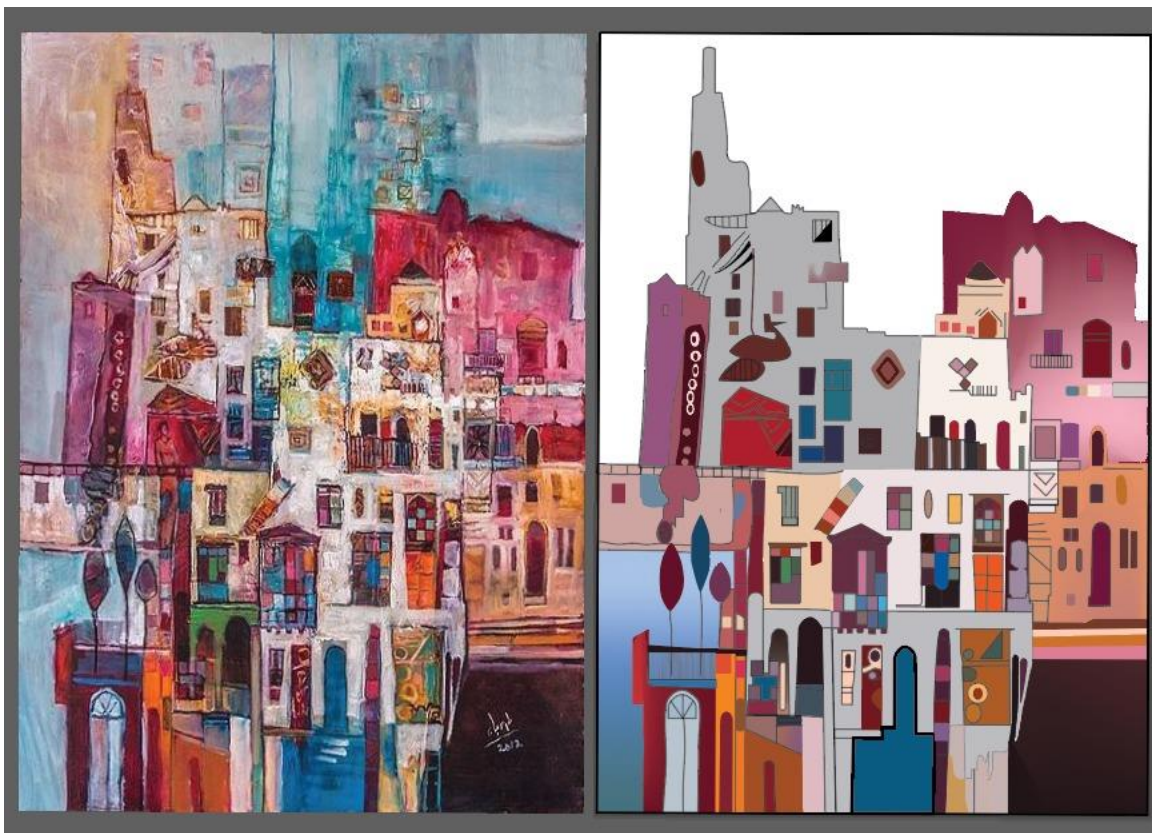
(شكل ٤) بدون عنوان عمل يعبر عن العمران الحجازي ٢٠١٤