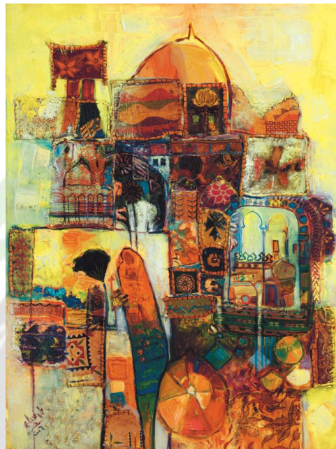
(شكل ٣) الموروث الشعبي وسطوة الألوان الحارة ٢٠٠٦