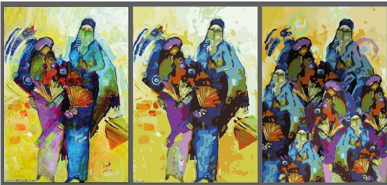
(شكل ٦) المرأة الحجازية بلبسها التراثي ٢٠١٣