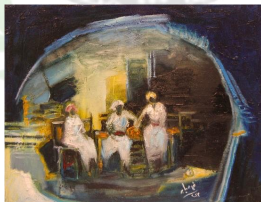
(شكل ٢) بدون عنوان ٢٠١٣