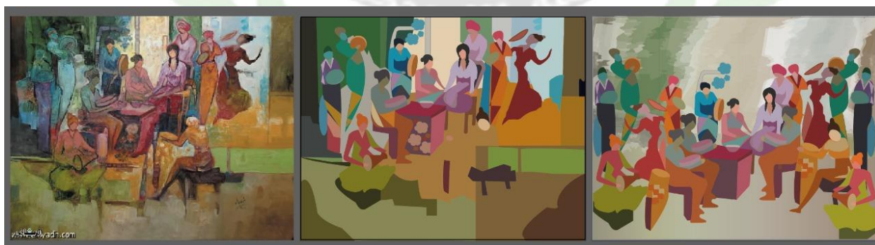
(شكل ٥) من فلكلور الافراح الشعبية في البيئة الحجازية ٢٠٠٨