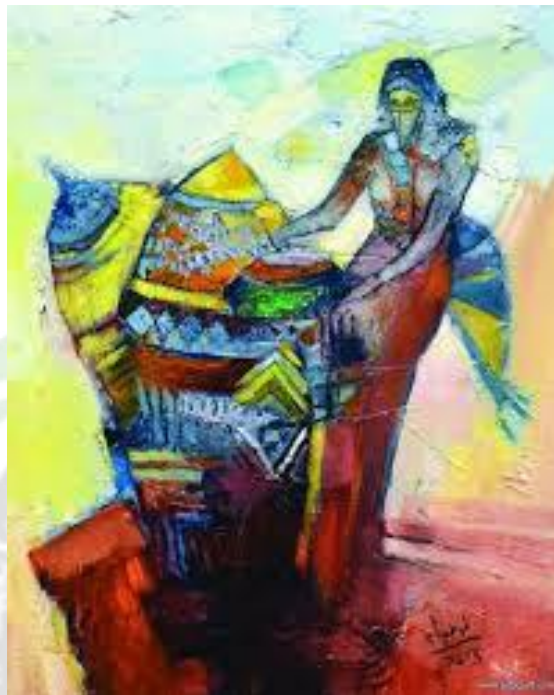
(شكل ١) بدون عنوان عمل يعبر عن الفتاة الحجازية ٢٠١٣